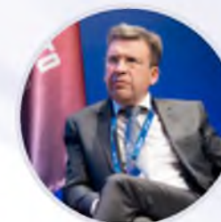
Владлен Максимов Президент Ассоциации малоформатной торговли России