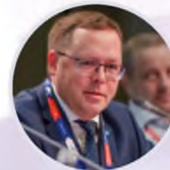
Андрей Карпов Председатель правления Российской Ассоциации экспертов рынка ритейла