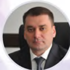
Алексей Гусев Министр торговли и услуг Республики Башкортостан