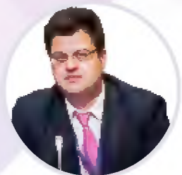
Никита Кузнецов Директор Департамента развития внутренней торговли Минпромторга России