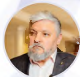
Игорь Бухаров Президент Федерации Рестораторов и Отельеров России