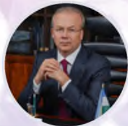
Андрей Назаров Премьер-министр Республики Башкортостан