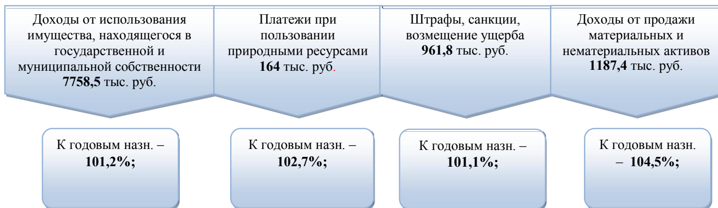
Рис. 2. Исполнение основных источников неналоговых доходов бюджета района

3. Безвозмездные поступления от других бюджетов бюджетной системы РФ в 2017 году запланированы в бюджете района в объеме 132707,3 тыс. рублей. Исполнение составило 132587,7 тыс. рублей или 99,9% плановых назначений из них: